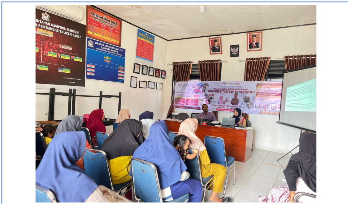
Gambar 2. Kegiatan Pengabdian