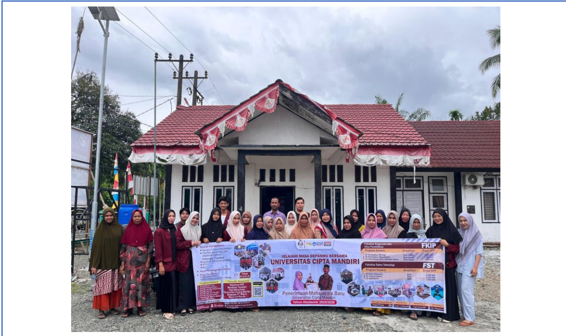
Gambar 1. Kegiatan Pengabdian